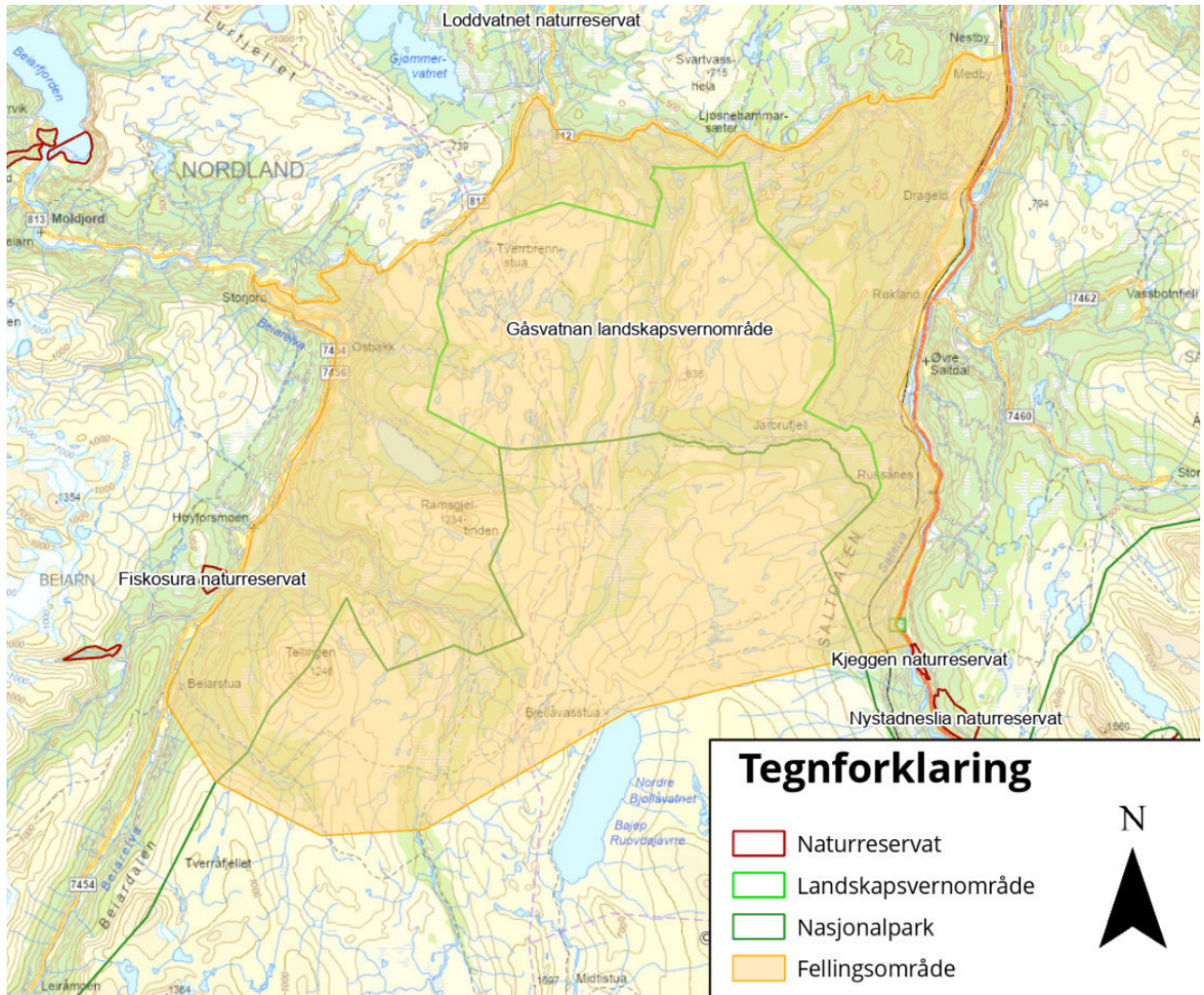
Kart over fellingsområde.