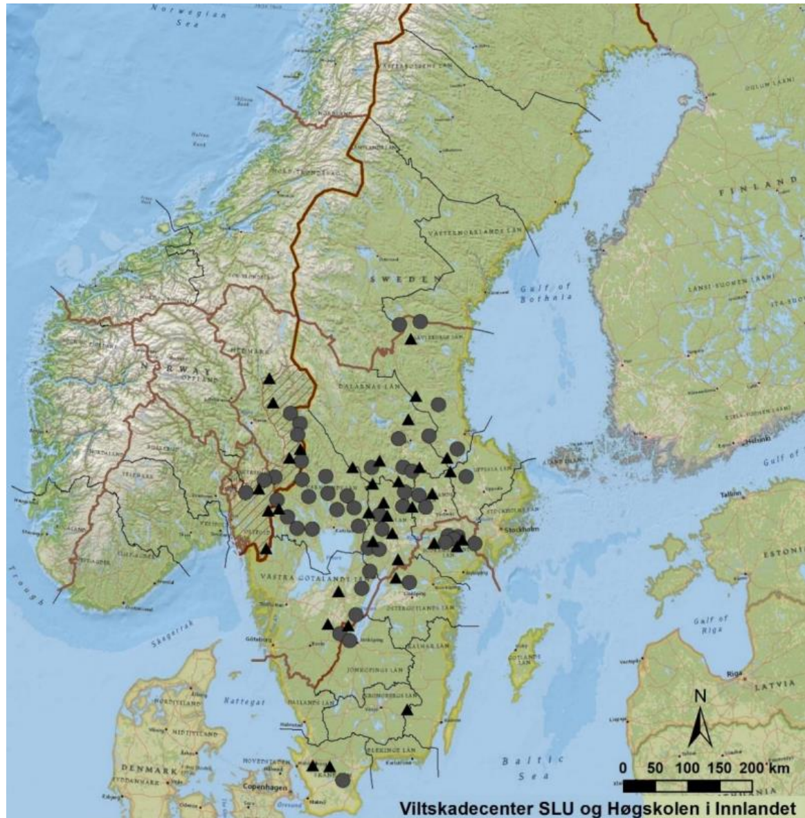
Figur 1: Dokumenterte familiegrupper (sirkel) og revirmarkerende par (trekant) i Skandinavia vinteren 2022-2023. Grenser for forvaltningsregioner (brune linjer) i begge land er vist, og skravert område viser norsk forvaltningsområde for ulv. Figuren er hentet fra NINA rapport nr. 1 2023 – Bestandsovervåking av ulv vinteren 2022-2023.